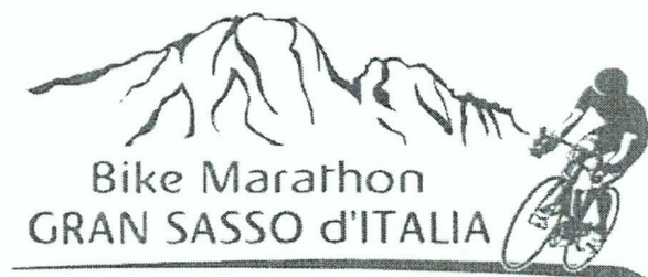
TABELLA DI MARCIA