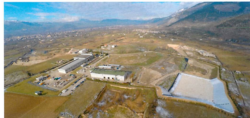
Impianti COGESA S.p.A. - Via Vicenne, loc. Noce Mattei - SULMONA (AQ)