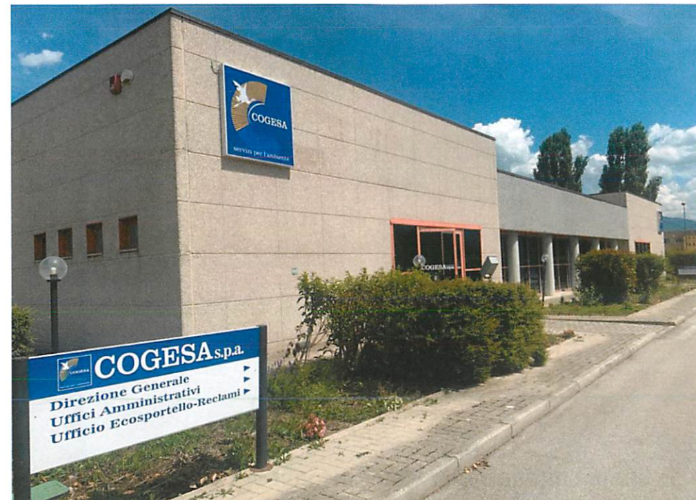
Uffici COGESA S.p.A. - S.S. 17 Km. 95,500 - SULMONA (AQ)